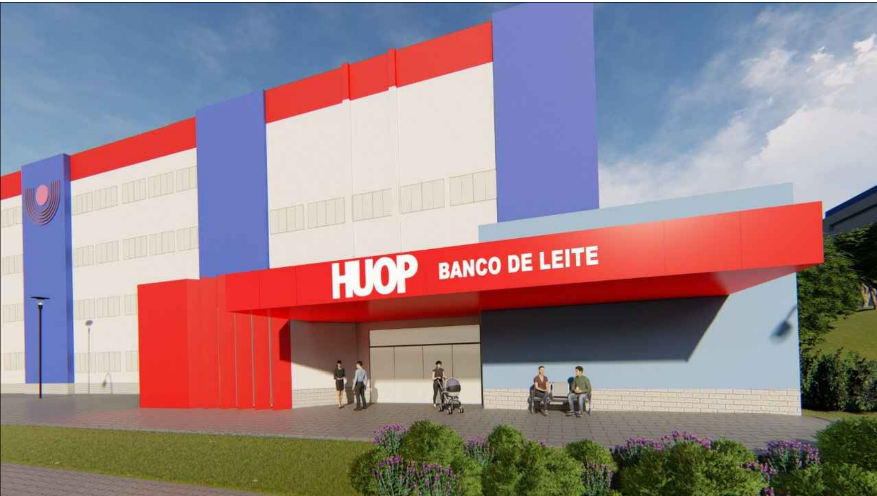
PERSPECTIVA BANCO DE LEITE LEITREIROS LUMINOSOS SEM ESCALA