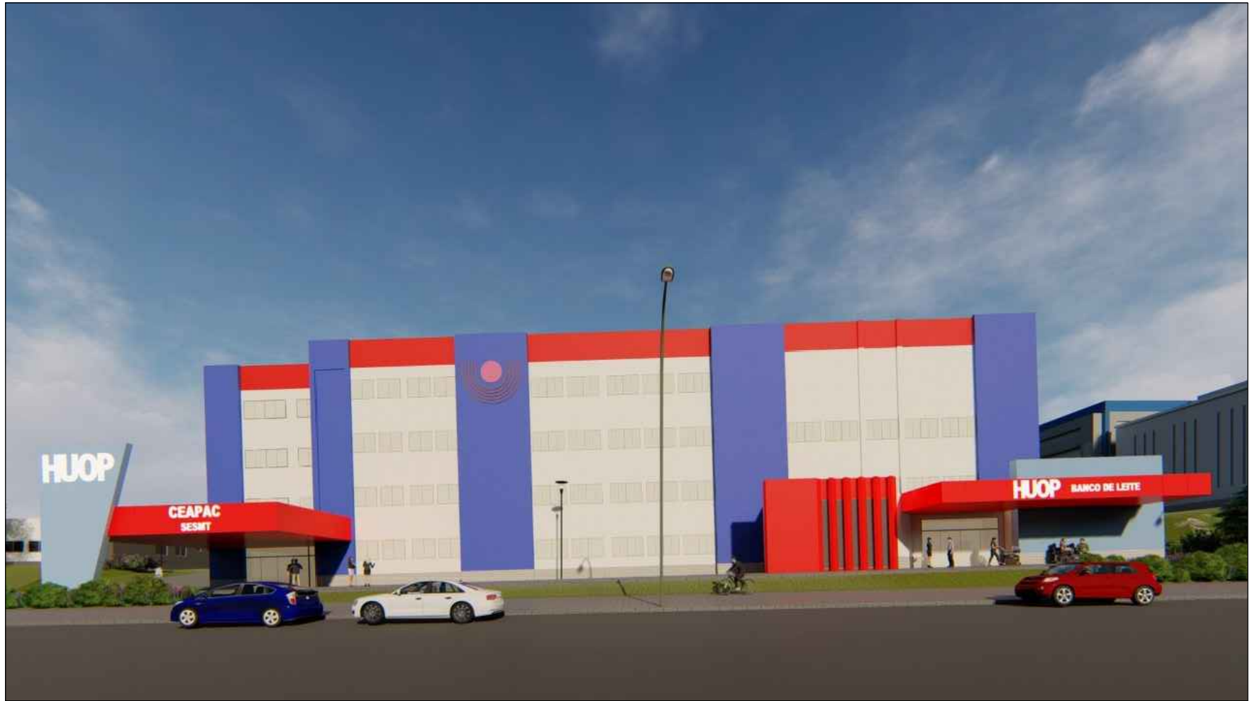
PERSPECTIVA CEAPAC / SESMT LEITREIROS LUMINOSOS SEM ESCALA