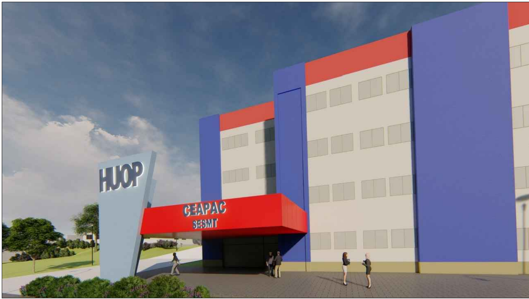
PERSPECTIVA BANCO DE LEITE LEITREIROS LUMINOSOS SEM ESCALA

ATENÇÃO: O PROJETO ARQUITETÔNICO É A CONCEPÇÃO DA OBRA DE ARQUITETURA, SUA REPRESENTAÇÃO ESTÉTICA E FUNCIONAL. ESSA REPRESENTAÇÃO NÃO ISENTA OS DEBATES PROJETOS COMPLEMENTARES (ESTRUTURAL, HIDRÁULICO, ELÉTRICO, TELEFONIA E LÓGICA, CLIMATIZAÇÃO, LUMINOTÉCNICA, AUTOMAÇÃO, SEGURANÇA, PROTEÇÃO CONTRA INCÊNDIO, ETC.) DEVENDO OBRIGATORIAMENTE SEREM ELABORADOS A PARTIR DO PROJETO ARQUITETÔNICO PARA A EXECUÇÃO DA OBRA.