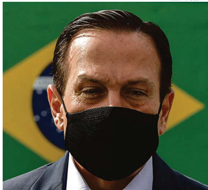
Assessoria de Doria disse que ele viajou ao Rio a lazer no fim de semana: governador havia pedido para paulistas não aglomerarem

Sem mencionar o nome de Doria, o senador Flávio Bolsonaro (Patriota-RJ), filho do presidente Bolsonaro, publi-