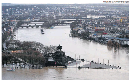
Na Alemanha. Chuvas prejudicaram logística no Rio Reno, com alta no preço do transporte

Prejuízo para 2022. A geadas também reduziu as safras de cana-de-açúcar e café. No caso do café, a queda deve ser de pouco mais de 10%, de 48 milhões de sacas para 43 milhões. Essa redução fez o preço subir 20% em um mês, atingindo o recorde em sete anos no dia 28 de julho, quando a saca foi cotada a US$ 207,73.