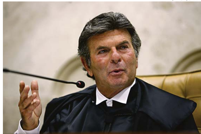
Ministro Luiz Fux: corte irá analisar pedido da AGU para que anule ordem de Mello sobre inquérito envolvendo Moro e Bolsonaro

A AGU, então, apresentou recurso. Como Celso de Mello estava de licença médica, coube ao segundo integrante mais antigo da corte, ministro Marco Aurélio, tomar uma decisão sobre o caso.