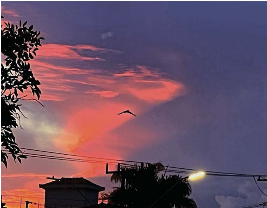
“Ganha quem tiver um cantinho do olhar para o céu londrinense.”

Envie sua foto: opiniao@folhadelondrina.com.br