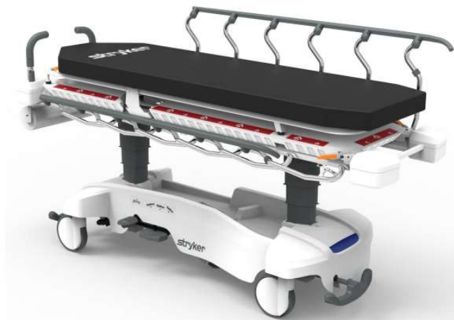
Figura 1. Foto ilustrativa da maca ST1 Stryker retirada do manual

Informamos que a maca da série ST1 , da marca Stryker possui o sistema glideaway , que se caracteriza pelo deslizamento das grades de forma a prevenir possíveis acidentes, tais como, esmagamento ao abaixar as mesmas. Quando baixadas elas são posicionadas abaixo e de forma retraída em relação ao deck ou base da maca possibilitando espaço livre para subida ou descida do paciente. Esta característica possibilita um movimento seguro tanto ao paciente quanto ao cuidador. É importante a leitura do manual do operador para correta utilização do equipamento. As grades são feitas em aço inoxidável e possuem o seguinte tamanho: 147cm de comprimento e 71 cm de largura quando posicionados para cima.